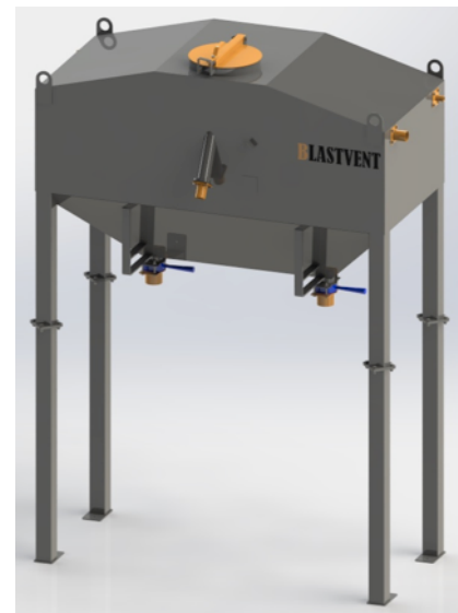
* Вакуумный бункер-накопитель VSH-1000-2